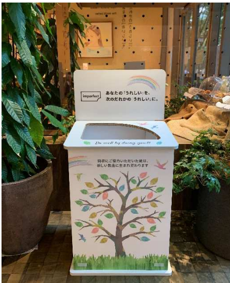
imperfect 表参道店舗に設置した回収ボックス 全て紙でできています

店舗に設置する回収ボックスには、木のイラストが描かれています。回収にご協力いただいたお客さまには、その木に葉っぱをかたどったシールを貼っていただくことで、お客さまと一緒に生い茂った賑やかな森を作り上げる予定です。