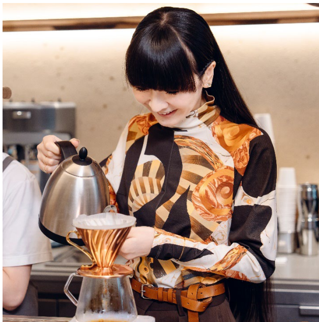
(imperfect でオリジナルブレンドを検討している様子。)