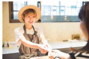
商品をご購入頂くと投票チップをお渡し