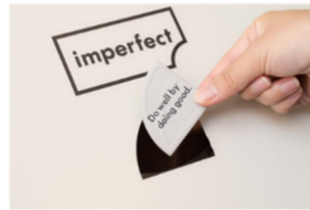
imperfectのロゴの欠けた部分をみんなのアクションで埋めるという想いを込めた形