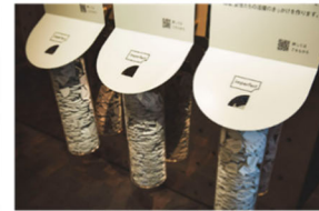
投票ボックスが透明で投票の様子が見えるのもポイント