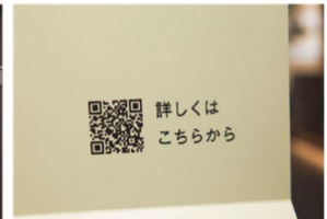
QRコードからプロジェクトの概要をご覧いただけます