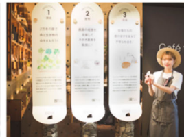
応援したいプロジェクトに投票